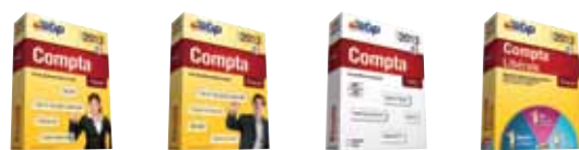
Compta Pratic Open Line™ 2013 Compta Classic Open Line™ 2013 Compta PRO Open Line™ 2013 Compta Libérale Classic Open Line™ 2013