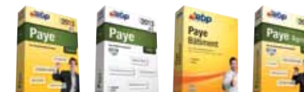
Paye Classic Open Line™ 2013 Paye PRO Open Line™ 2013 Paye Bâtiment 2012 Paye Agricole 2013