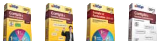
Compta & Devis-Factures Pratic Open Line™ 2013 Compta & Gestion Commerciale Classic Open Line™ 2013 Compta et Facturation Libérale Classic Open Line™ 2013 Compta & Gestion Commerciale PRO Open Line™ 2013