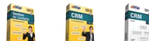
Gestion de Contacts Pratic Open Line™ 2013