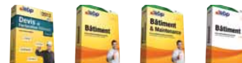
Devis et Facturation Bâtiment Classic 2013 Bâtiment 2012 Bâtiment & Maintenance 2012 Bâtiment PRO v13